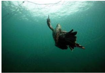
Un cormorán moñudo joven ahogado hace unos días en un enmalle. fernando fonticiella

La elevada mortalidad de cormoranes moñudos al quedar enmallados mientras bucean para pescar está amenazando la supervivencia de esta ave marina protegida en Asturias. El problema no es nuevo y, de hecho, ha sido puesto en evidencia en repetidas ocasiones, pero no se han tomado medidas para resolverlo y se está agravando, hasta el punto de que ha comenzado a repercutir en la evolución de su población.